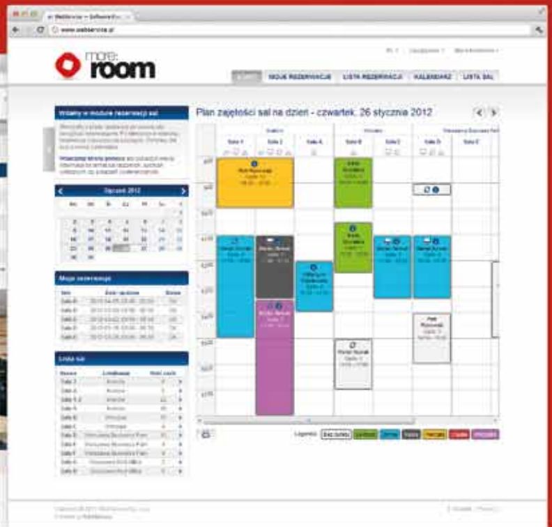
Widok ekranu głównego aplikacji.